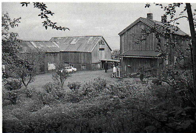
Klemetsaunet. En ubebodd gård som fra våren 1985 blir skueplass for yrende kolonistaktivitet.