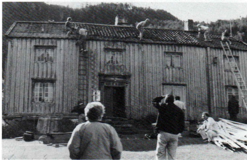
36 kolonister var med på å redde trønderlåna på Klemmetsaunet.

Det var med andre ord en kjempeinnsats som ble utført og deltakerne