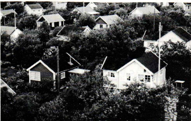
Det er hyttene — bomulighetene i ferie og fritid — som skaper miljøet — det sosiale samvær — rekreasjon avstressing og helseter i kolonihagen.

— Nei kolonister, vi må nok belage oss på å vente på at de folkevalgte i Trondheim kommune skal skaffe seg mer viten om hva en kolonihage er for noe.